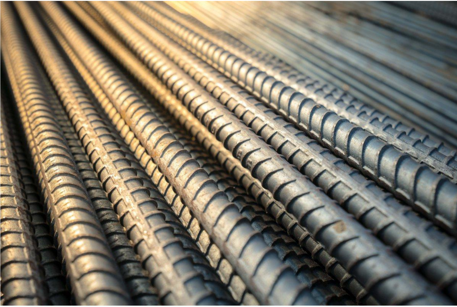
İnşaat Demiri Fiyatları