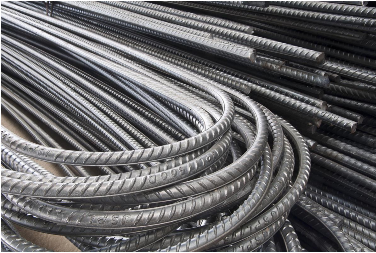
İnşaat Demir Fiyatları